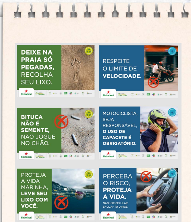
Campanha de educação ambiental em vigor em Jericoacoara e Preá